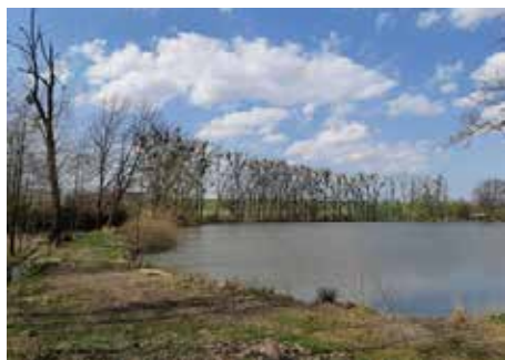
Jmelím napadené stromy u rybníka.

Velkým problémem nejen v naší obci začíná být poloparazit jmelí, které výrazně oslabuje vitalitu stromů a díky tomu stromy chřadnou a usychají. Rádi bychom zamezili tomuto parazitu další ničení našich stromů, proto připravujeme projekt na jeho likvidaci (zejména ořezem). Aby tato likvidace byla účinná, je nutné, abychom pečlivě provedli zásahy na celém