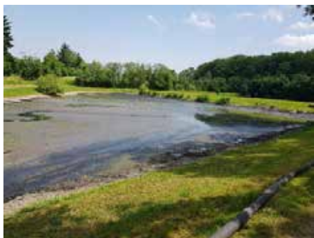
Odbahnění 1. pročišťovací nádrže kanalizace

opravit jsou uliční vpusti a v některých úsecích budeme muset provést pročištění zanesené kanalizace. V měsíci červnu již bylo na spodním konci provedeno odbahnění 1. pročišťovací nádrže kanalizace.